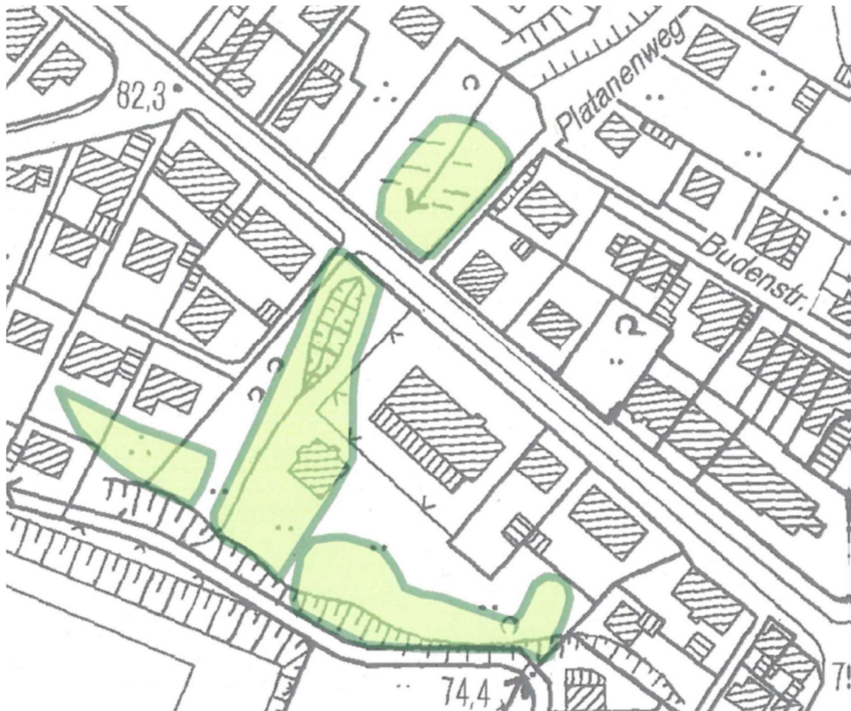
Abb.6 - Altlasten- und Hinweisflächenkarte (Ausschnitt)

Im Bereich des Plangebietes ist im Altlasten- und Hinweisflächenkataster des Rhein-Sieg-Kreises eine Altablagerungshinweisfläche nachrichtlich erfasst. Die Fläche wurde durch Luftbildinterpretation und Auswertung historischer Karten ermittelt. In der DGK-5 von 1966 sind mehrere Fischteiche zu erkennen.