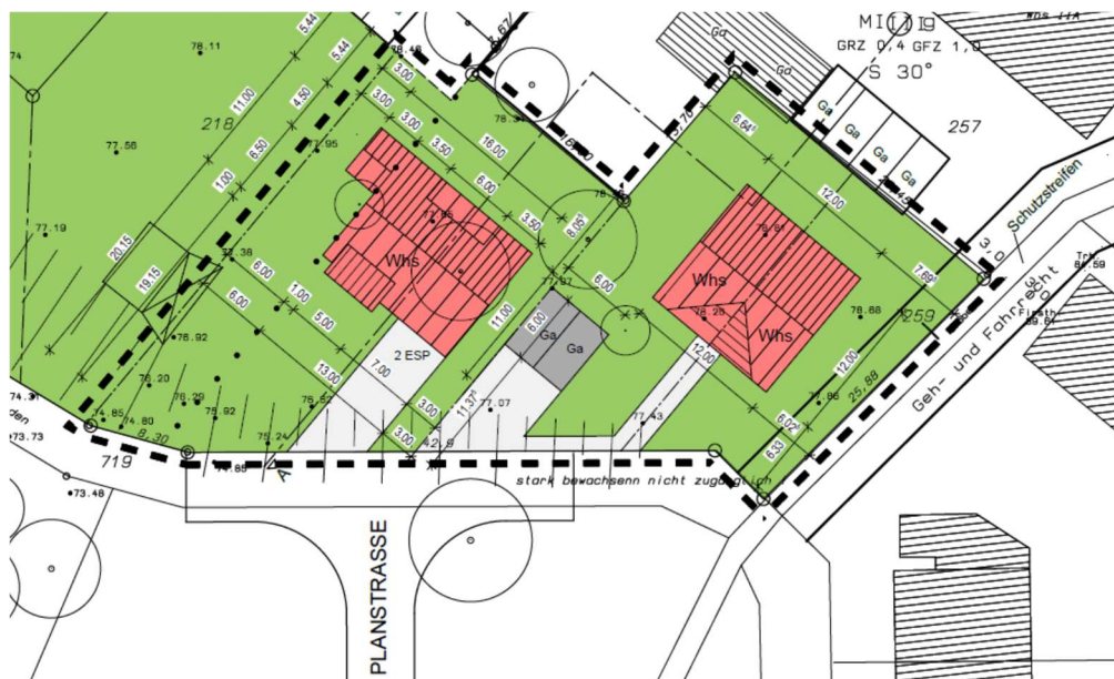
Abb.1 – Städtebaulicher Entwurf

Mit Schreiben vom 10.09.2019 wurde seitens eines privaten Grundstückseigentümers, die Einleitung des Verfahrens zur Aufstellung eines Bebauungsplanes für ein Wohnbauprojekt im Siegburger Stadtteil Kaldauen beantragt. Das rund 1500 qm große Plangebiet liegt im rückwärtigen Bereich der bebauten Grundstücke Hauptstraße Nr. 36, 38 und 40, nördlich des im Jahr 2019/2020 errichteten Schwarzdornweges. Der Antragsteller plant die Realisierung von Wohngebäuden mit jeweils maximal 2 Vollgeschossen und geneigten Dächern. Im nachfolgenden städtebaulichen Entwurf sind beispielhaft ein Einzelhaus (Einfamilienhaus) und ein Doppelhaus dargestellt. Die Grundstücke sollen über den Schwarzdornweg (Abb. 1 „Planstraße“) erschlossen werden.