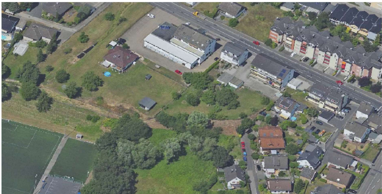
Abb. 4 und 5 – Luftbild / Schrägluftbild (2015)