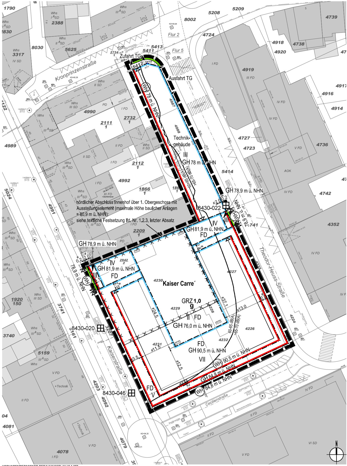
VORHABENBEZOGENER BEBAUUNGSPLAN M 1:250