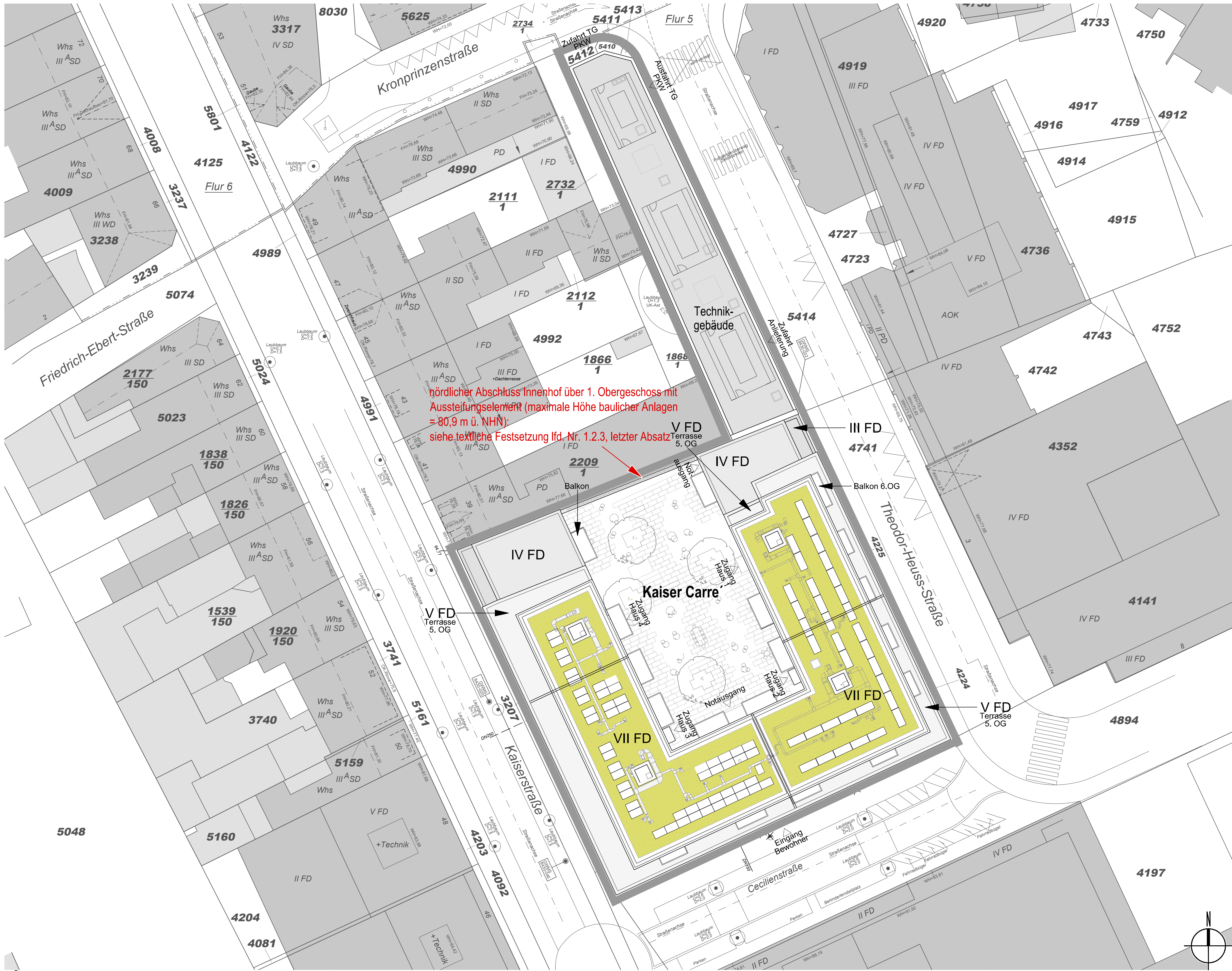
STÄDTBAULICHER ENTWURF M 1:250