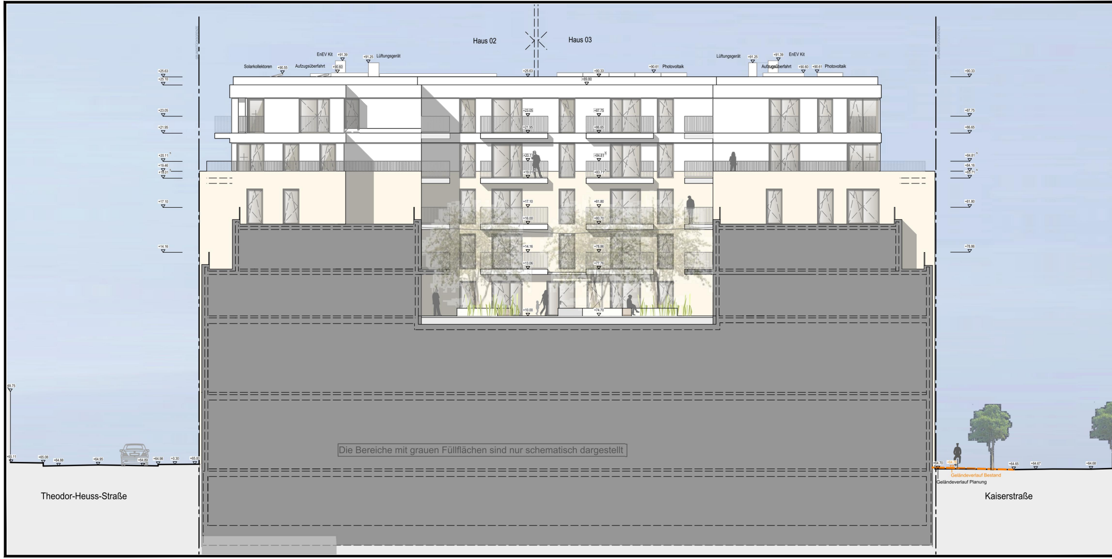
SCHNITT C-C M 1:250 - nur nachrichtlich -