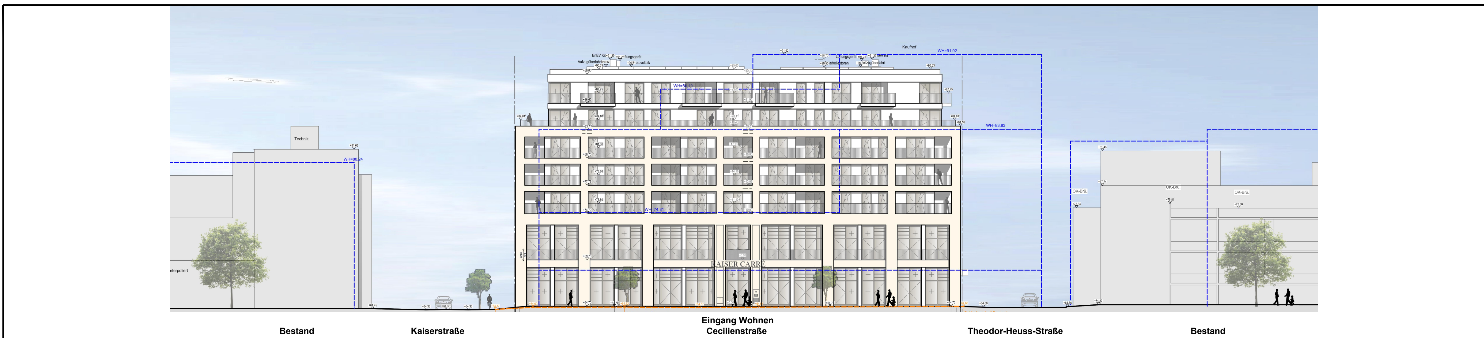
ANSICHT CECILIENSTRASSE M 1:250 - nur nachrichtlich -