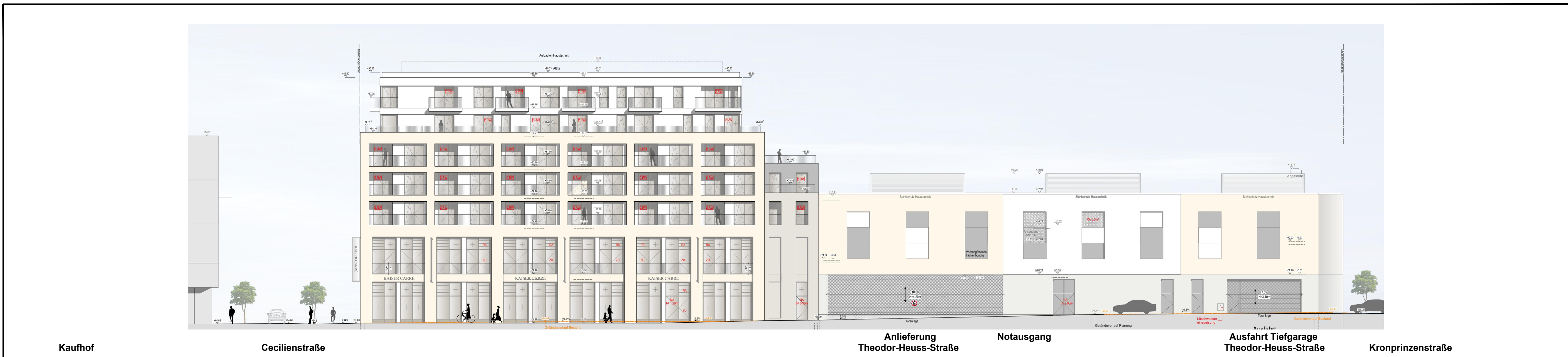
ANSICHT THEODOR-HEUSS-STRASSE M 1:250 - nur nachrichtlich -