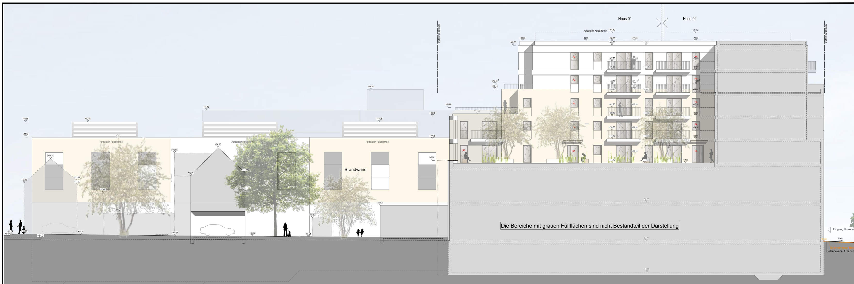
SCHNITT B-B M 1:250 - nur nachrichtlich -