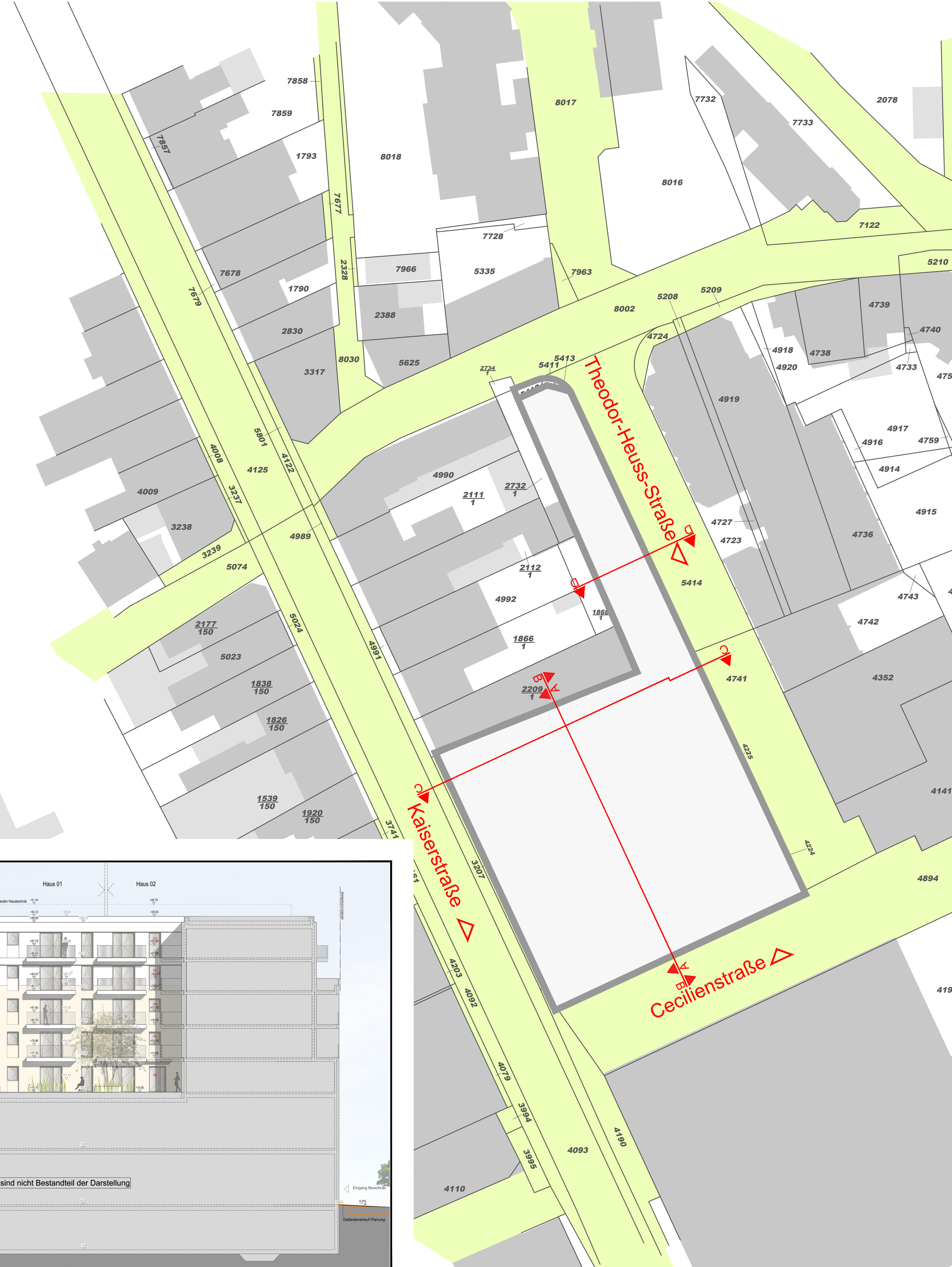
ÜBERSICHT ANSICHTEN SCHNITTE M 1:500 - nur nachrichtlich -