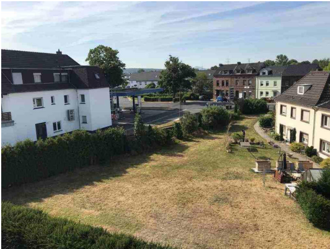
Blick auf das Plangebiet

Zur Erfassung der Vorhabenwirkungen wurde ein Untersuchungsbereich bis ca. 80 m um den Vorhabenbereich begangen (15.04.2020). In diesem Bereich wurden keine Nester bzw. Horste von planungsrelevanten Arten, wie Habicht, Sperber, Mäusebussard, Wander- oder Turmfalke gefunden.