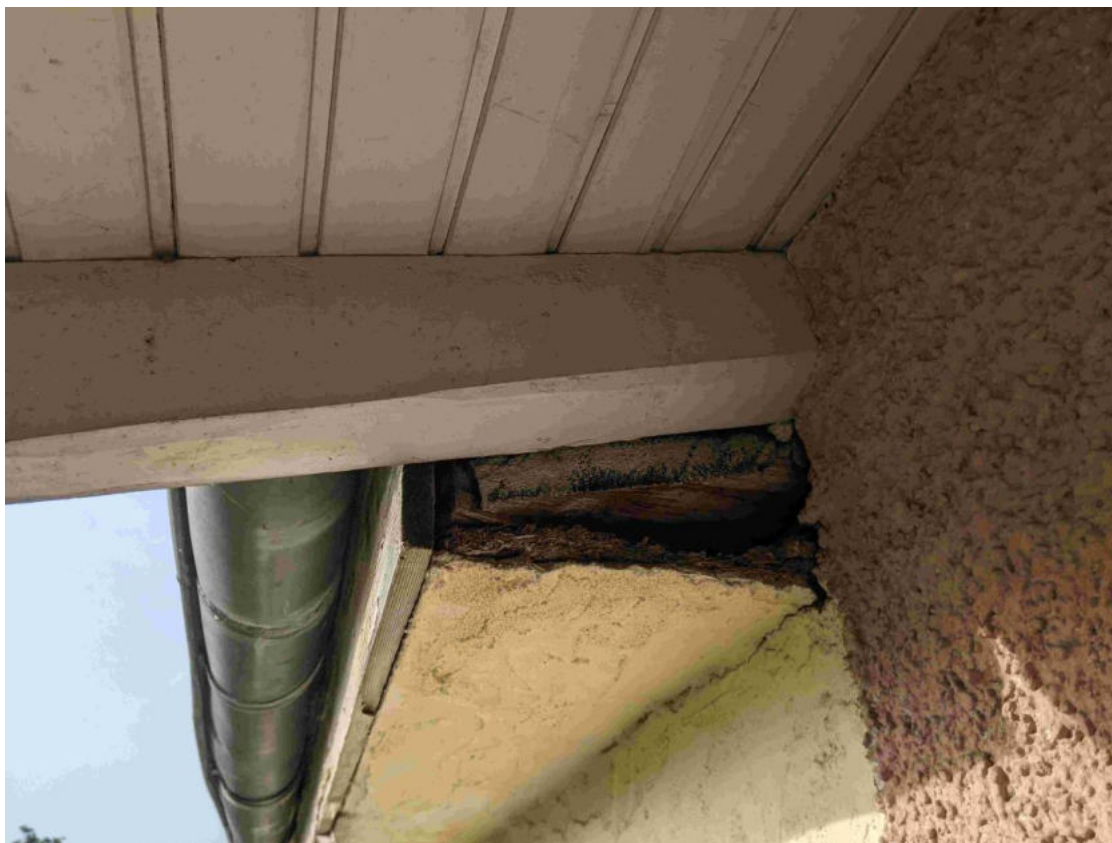
Nischen außen ohne Kotspuren oder andere Anzeichen