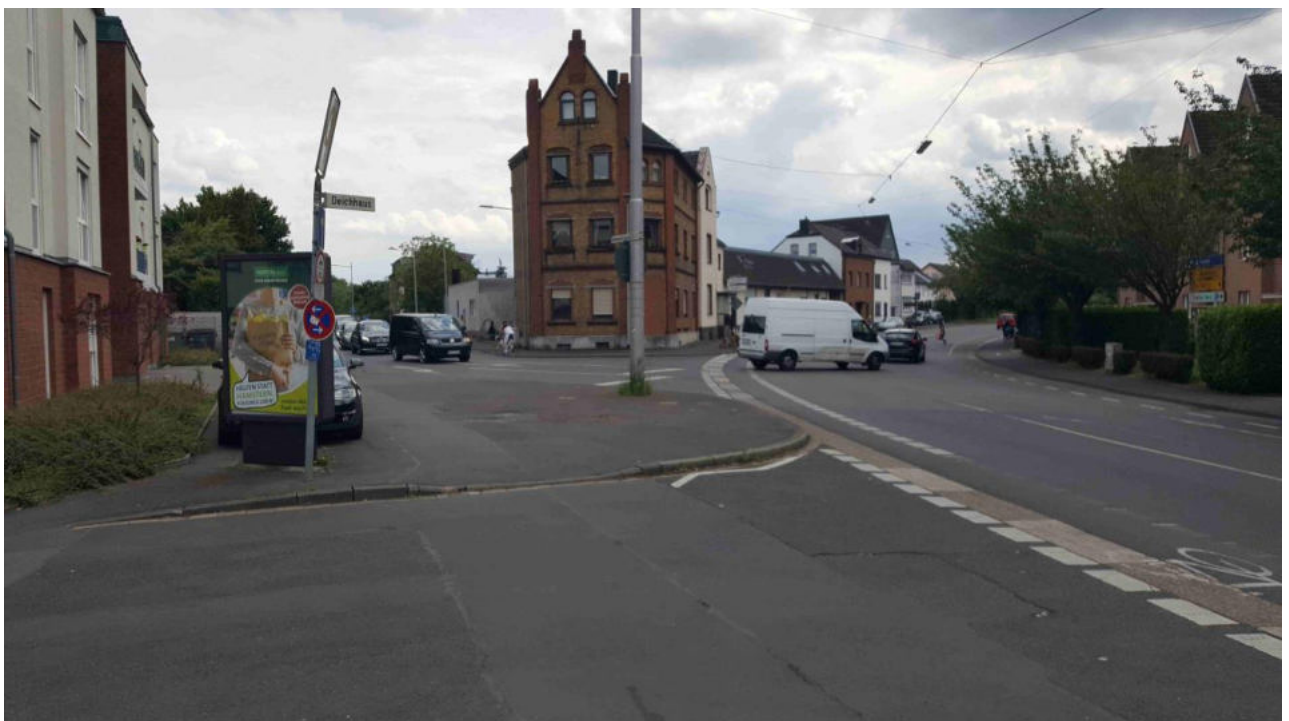
Situation Einmündung Deichhaus/Frankfurter Straße / Knoten Frankfurter Straße/Wahnbachtalstraße