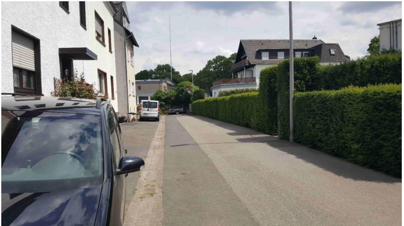
Situation im Bereich Deichhaus