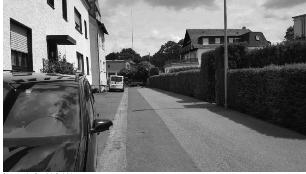
Situation im Bereich Deichhaus