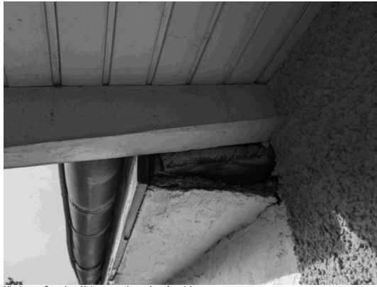
Nischen außen ohne Kotschäden oder andere Anzeichen