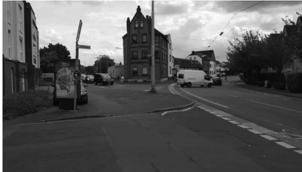
Situation Einmündung Deichhaus/Frankfurter Straße / Knoten Frankfurter Straße/Wahnbachtalstraße