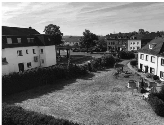
Blick auf das Plangebiet

Zur Erfassung der Vorhabenwirkungen wurde ein Untersuchungsbereich bis ca. 80 m um den Vorhabenbereich begangen (15.04.2020). In diesem Bereich wurden keine Nester bzw. Horste von planungsrelevanten Arten, wie Habicht, Sperber, Mäusebussard, Wander- oder Turmfalke gefunden.