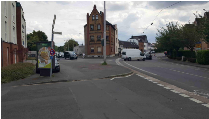
Situation Einmündung Deichhaus/Frankfurter Straße / Knoten Frankfurter Straße/Wahnbachtalstraße