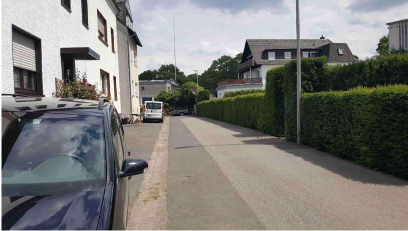
Situation im Bereich Deichhaus