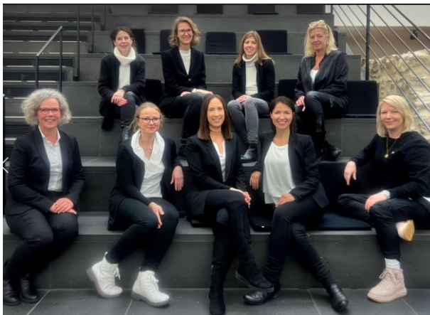
Das Team des Fachbereiches Tourismusförderung im Februar 2022

Die Besucher der Tourist Information lassen sich vereinfacht in zwei Gruppen unterteilen: Die einen kommen, um sich inspirieren zu lassen oder suchen allgemeine Informationen oder schauen sich um. Andere kommen, um sich ganz gezielt zu informieren. Dies gilt nicht nur für Touristen – denn die Tourist Information ist auch Anlaufpunkt für die Siegburger*innen.