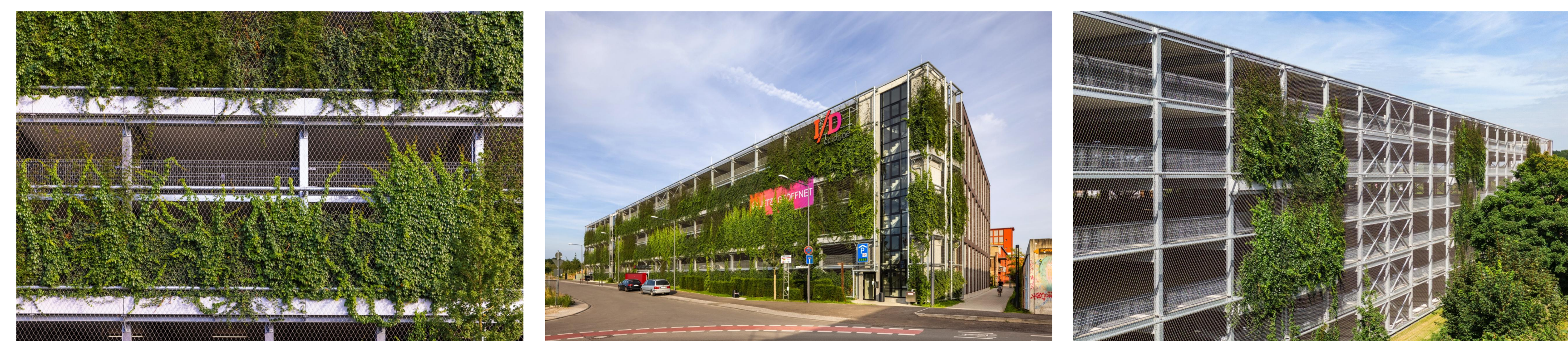
Fassadengestaltung Richtung Wohnbebauung

Diese Zeichnung ist geistiges Eigentum der Deutsche Industrie- und Parkhausbau GmbH. Vervielfältigung, Verwertung oder Weitergabe an dritte Personen ist ohne unser Einverständnis untersagt.