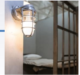
JVA Siegburg Ehrenamtliche Gruppe