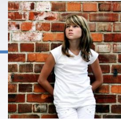
Keine Kinder im Obdach