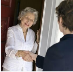
Ehrenamtliche Mitarbeit im SPZ

werden professionell von unserer Koordinatorin für das Ehrenamt begleitet