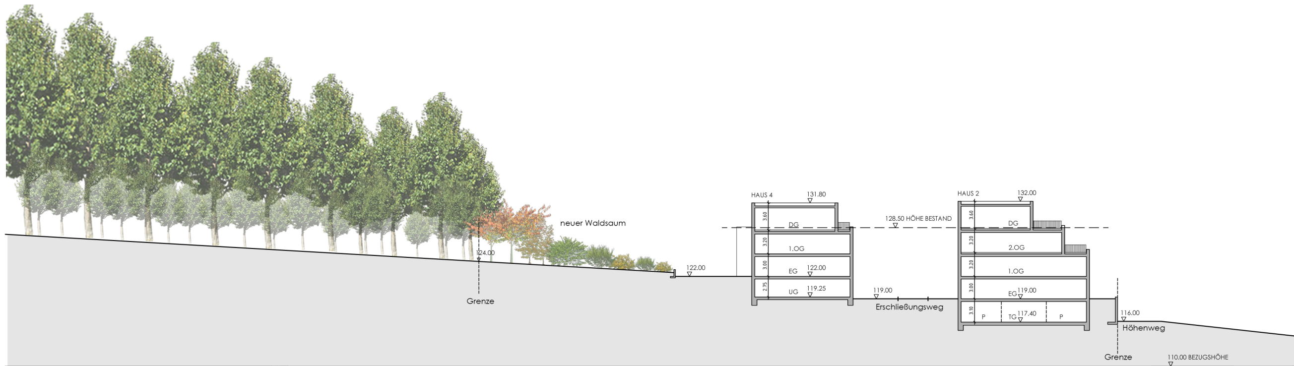
Höhensituation Nord-Süd A-A

Bauherr: Immobilienfonds Waldhotel Siegburg GbR