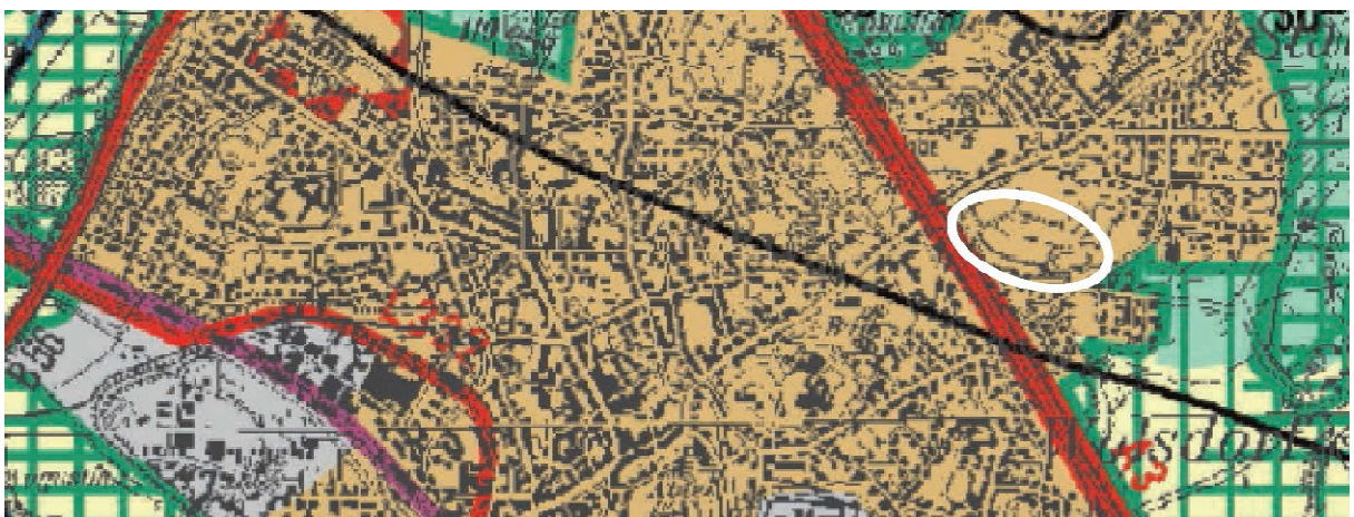
Abb.3 – Auszug aus dem Regionalplan (Der Planbereich ist weiß umrandet.)

Die Änderungsfläche liegt im Regionalplan für den Regierungsbezirk Köln, Teilabschnitt Bonn/Rhein-Sieg, innerhalb des „Allgemeinen Siedlungsbereichs“.