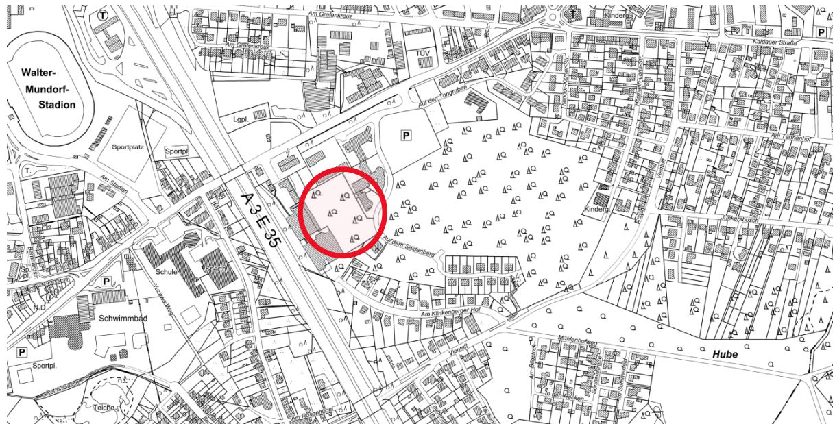
Abb.1 - Übersichtsplan

Das Plangebiet umfasst eine ca. 12.000 qm große Grundstücksfläche in der Gemarkung Wolsdorf, Flur 2, im Siegburger Stadtteil Stallberg, auf der Westseite des Seidenbergs, zwischen der Autobahn BAB 3 und der Straße „Auf dem Seidenberg“.