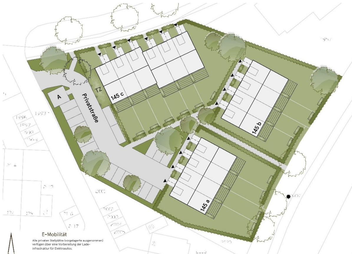
Abbildung 3: Städtebauliches Konzept Vorentwurf