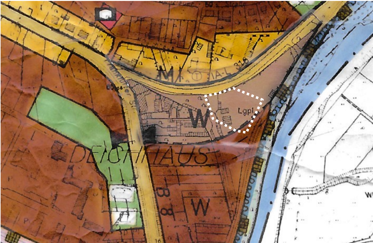
Abbildung 2: Ausschnitt des Flächennutzungsplans mit Geltungsbereich

Der wirksame Flächennutzungsplan (FNP) der Stadt Siegburg stellt den Bereich derzeit als Wohnbaufläche dar. Eine Berichtigung oder Änderung des Flächennutzungsplanes ist daher nicht erforderlich.