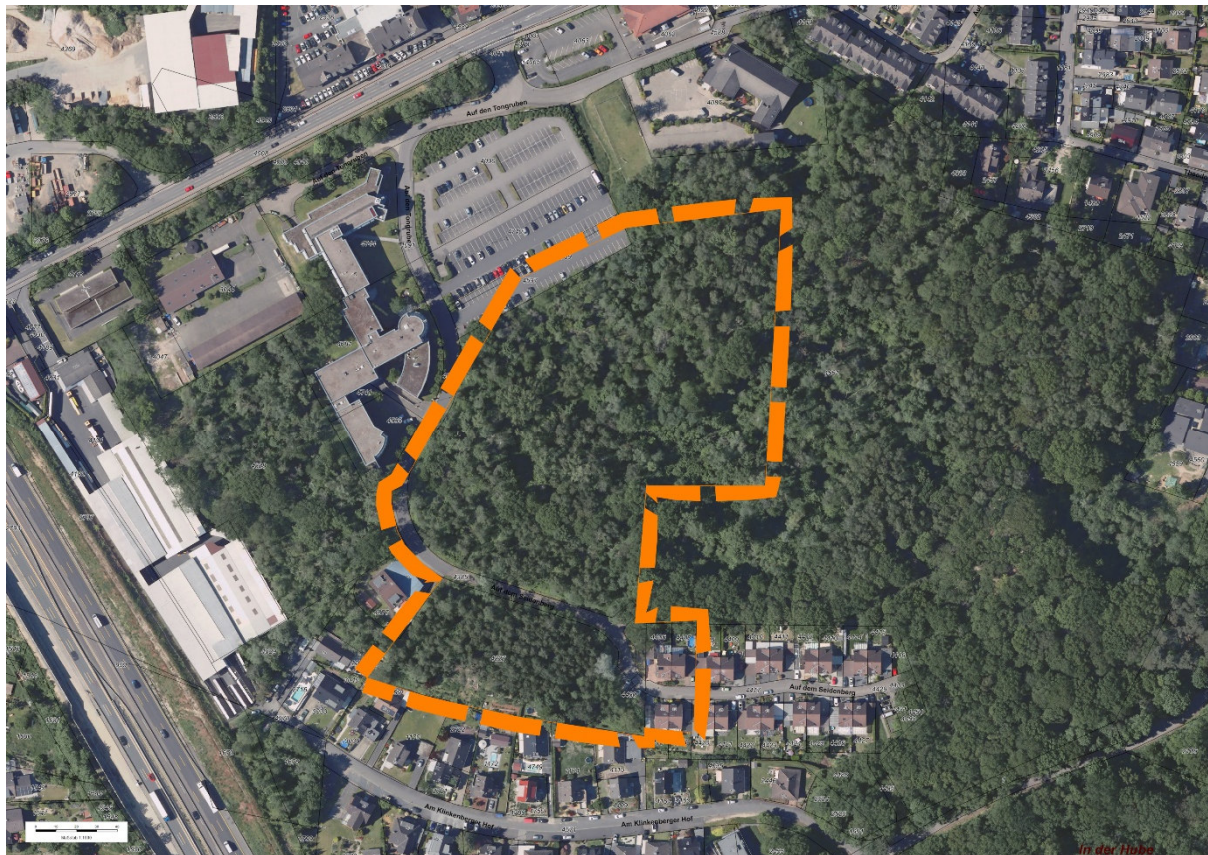
Abb.2 – Luftbild mit Abgrenzung des Änderungsgebietes