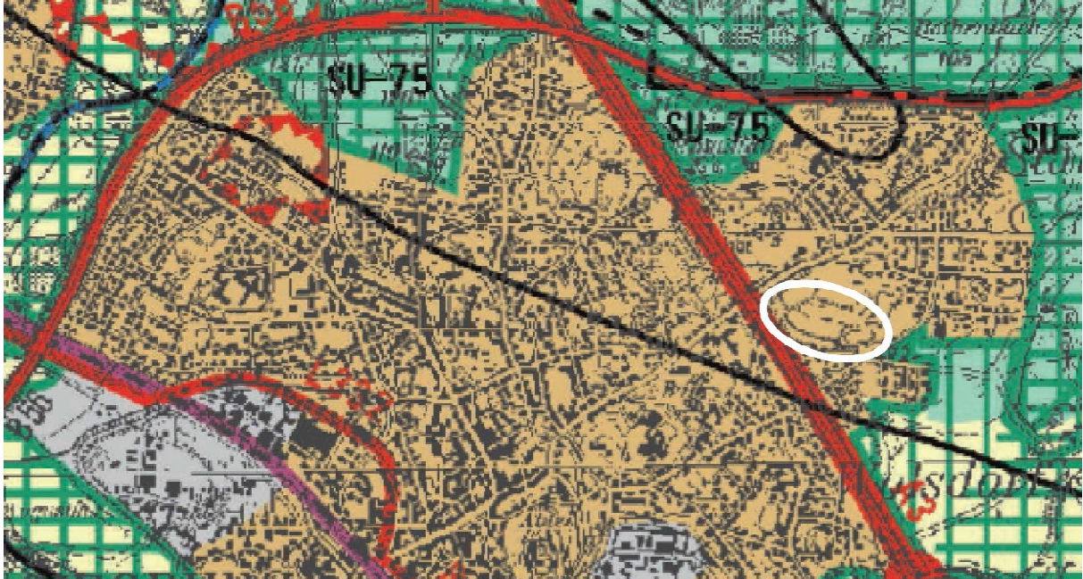
Abb.3 – Auszug aus dem Regionalplan (Der Planbereich ist weiß umrandet.)