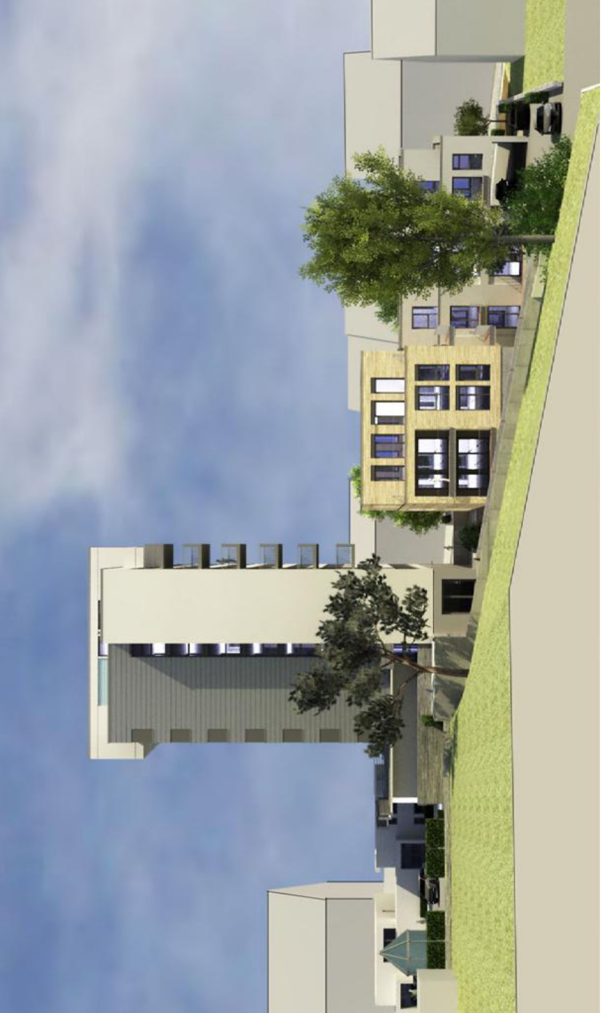
HÖHENABWICKLUNG BLICK HOFSEITE