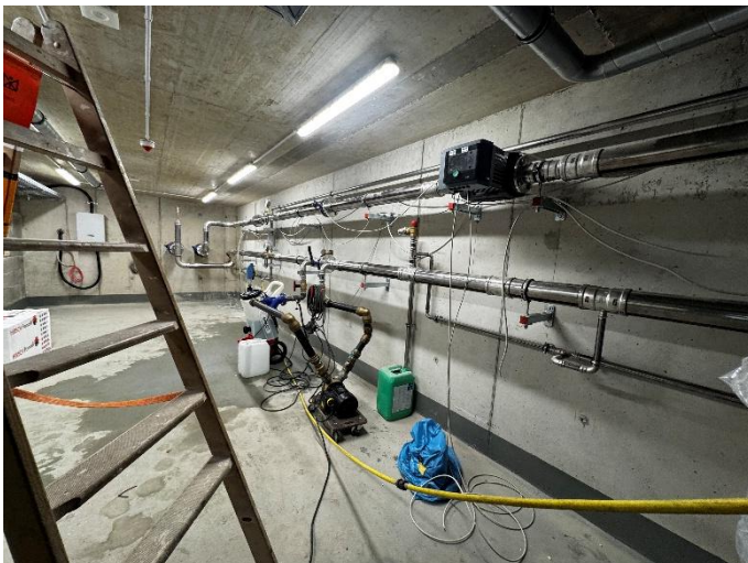
Technikraum Übergabe Geothermie