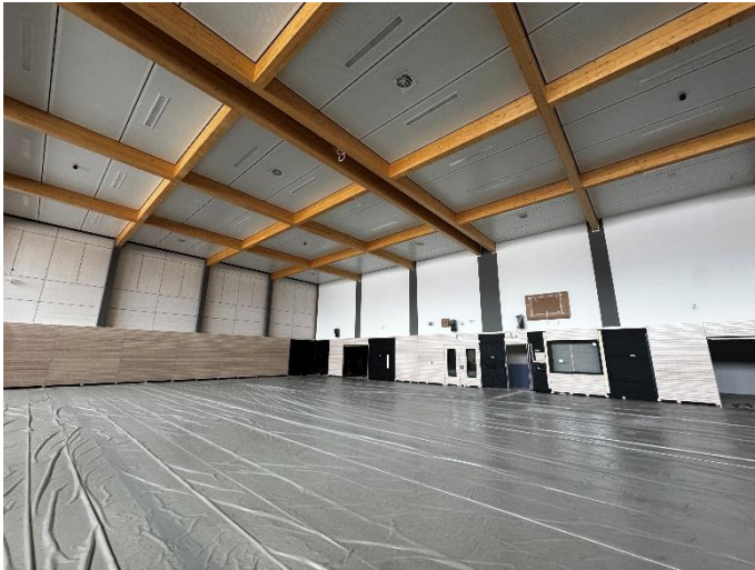
Hallo Obergeschoss Vorbereitung Böden