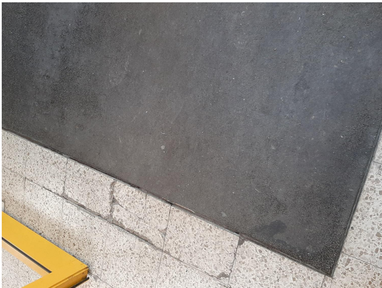
Fußmatte Eingangsbereich / Defekter Fliesenboden