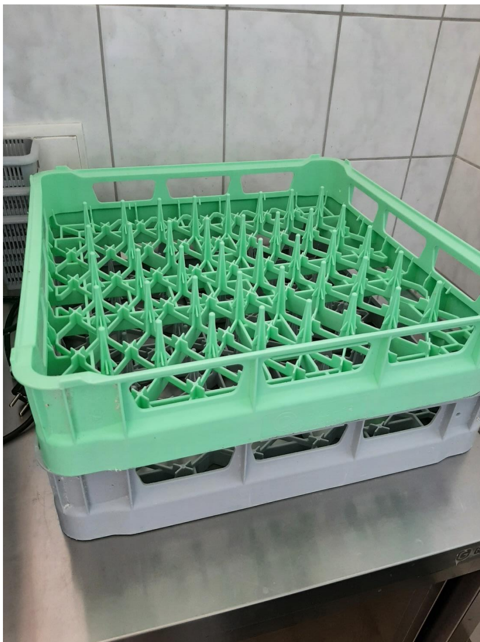
Gläserkörbe der Spülmaschine